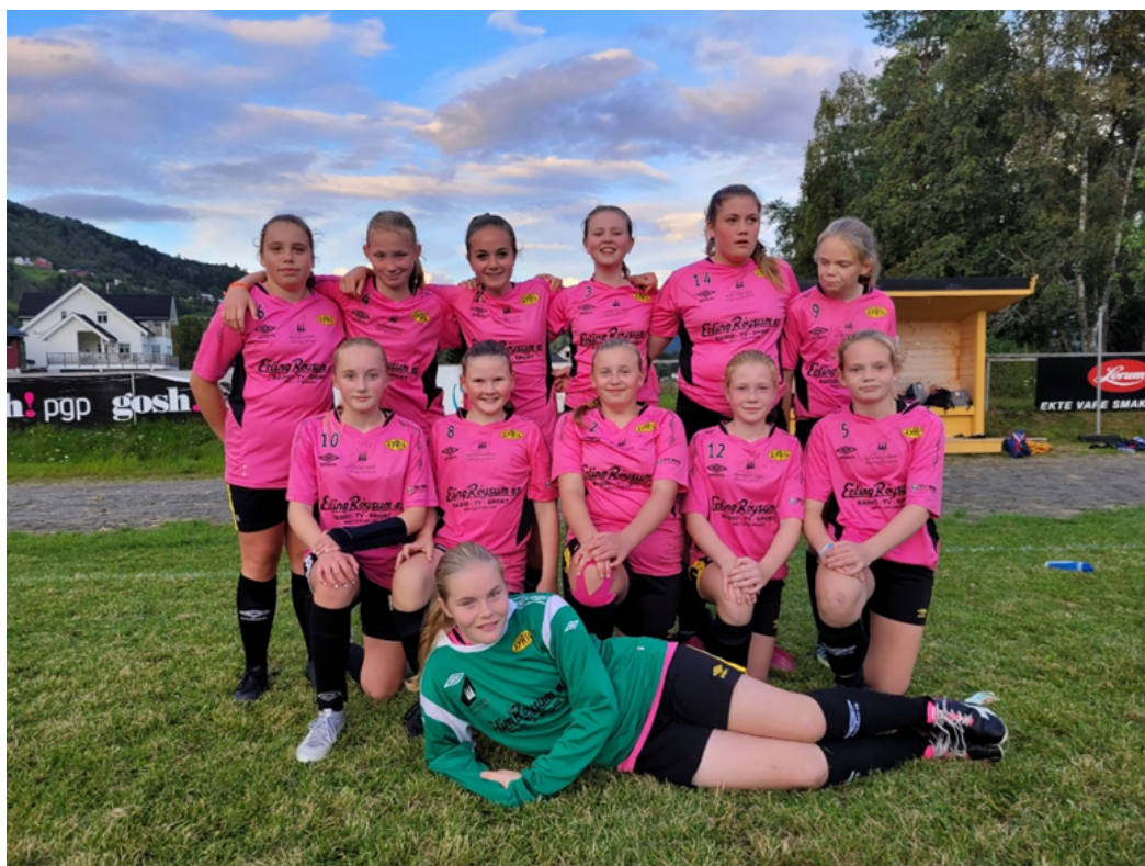
Syril J13 frå bortekampen mot Hafslo i august