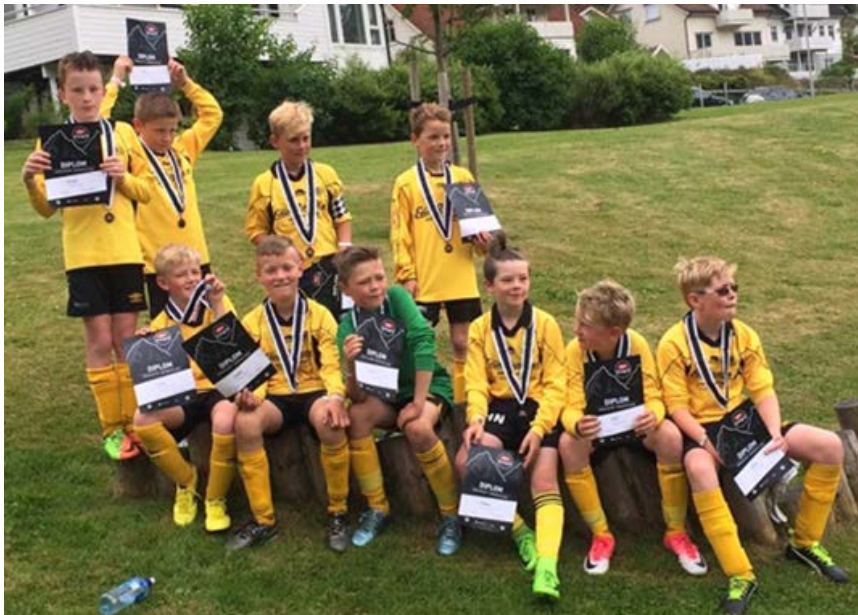
Ein fornøgd gjeng på Lerum Cup